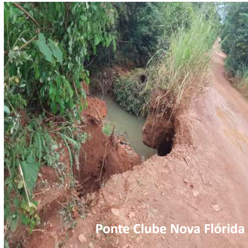
Ponte Clube Nova Flórida