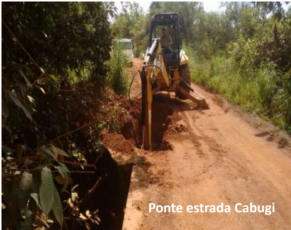
Ponte estrada Cabugi