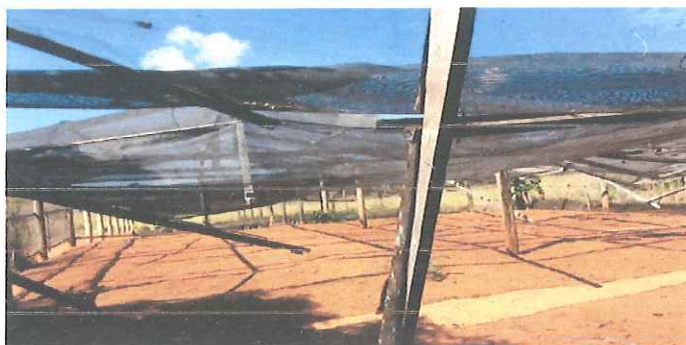
VIVEIRO DANIFICADO FOTO 2