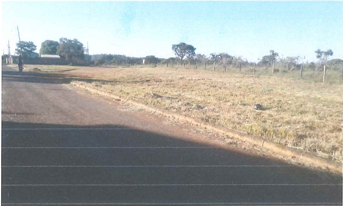
ÁREA PÚBLICA DE INTERESSE PELA COMUNIDADE NA EXECUÇÃO DA HORTA COMUNITÁRIA